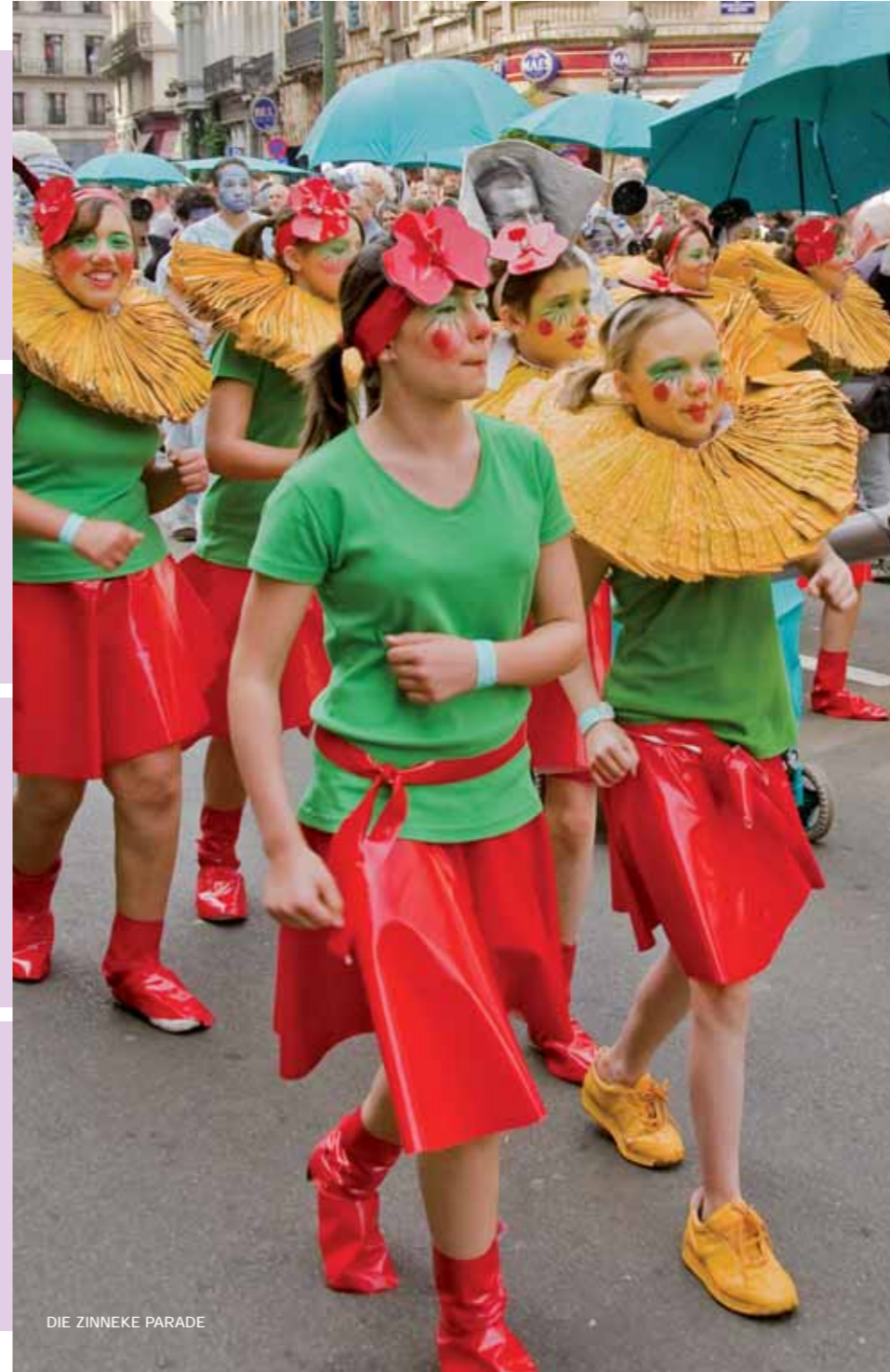
DIE ZINNEKE PARADE