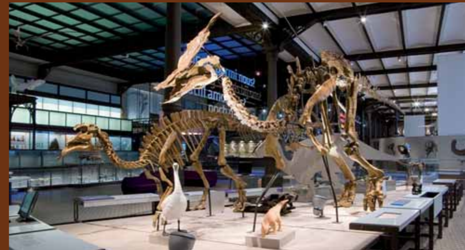
MUSEUM DER NATURWISSENSCHAFTEN