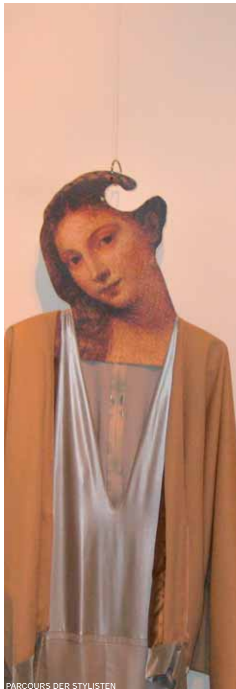
PARCOURS DER STYLISTEN