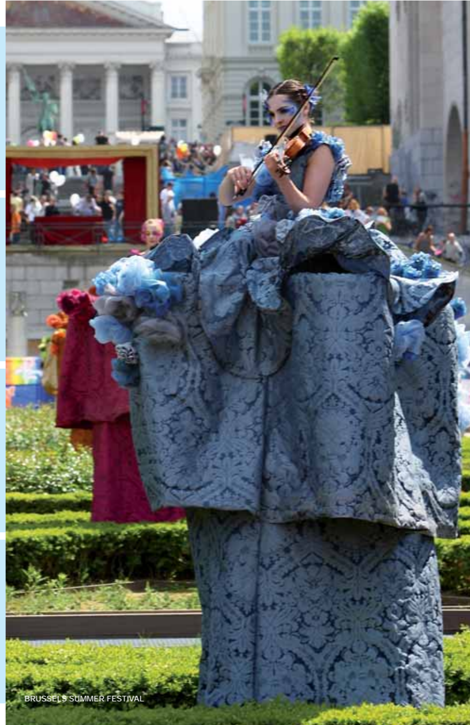
BRUSSELS SUMMER FESTIVAL